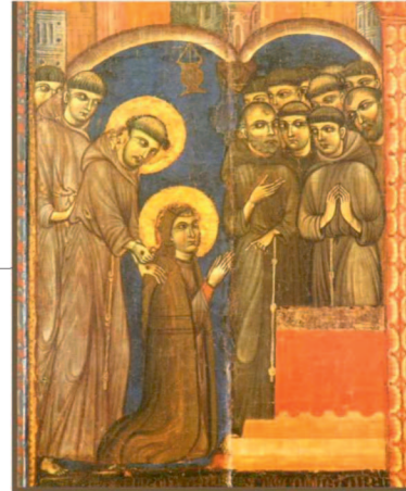
Ausschnitt aus der Klaratafel