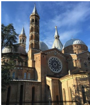
Padua (li) Carceri (re)